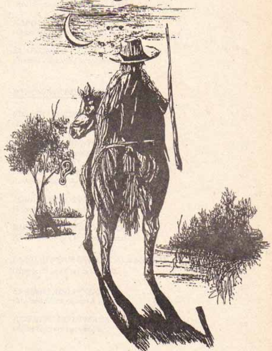
ILUSTRACION DE WLADIMIR BENJAMIN HERNANDEZ CORTEZ (EL SUREÑO)